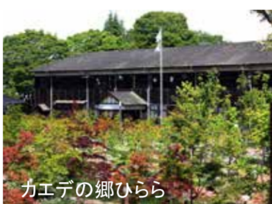
カエデの郷ひらら