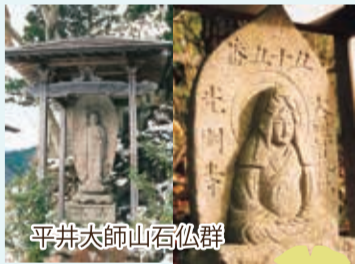
平井大師山石仏群