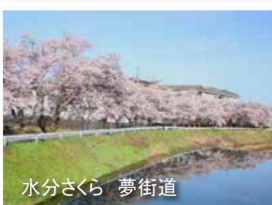
水分さくら 夢街道